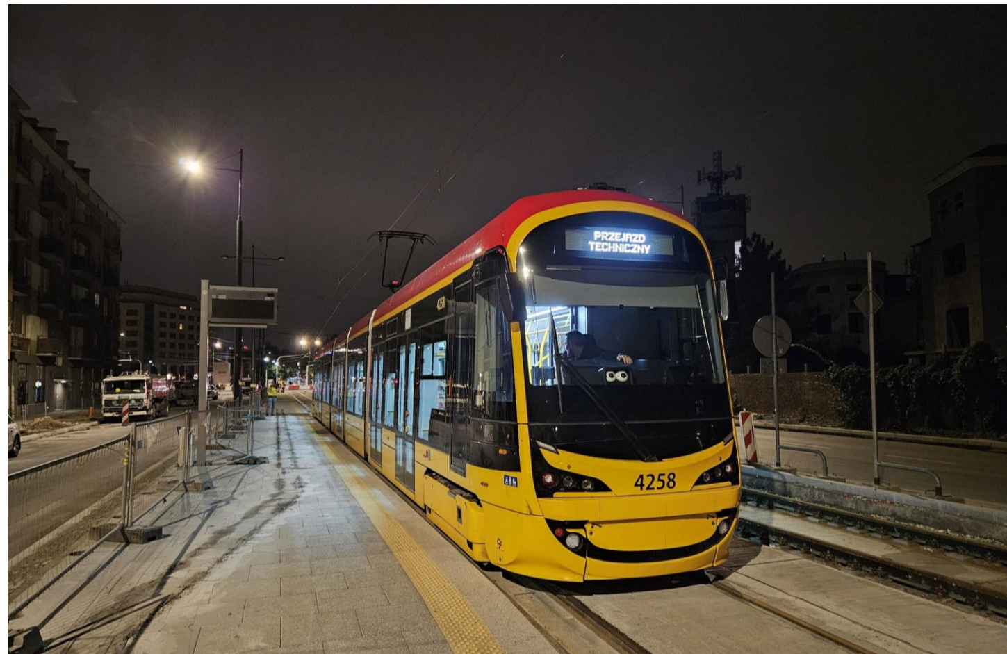
Jazdy testowe na nowej trasie tramwajowej ( tramwajdowilanowa.pl )