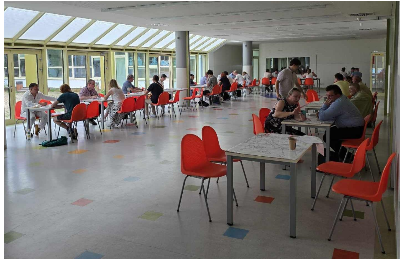
Dyżur konsultacyjny w Miasteczku Wilanów