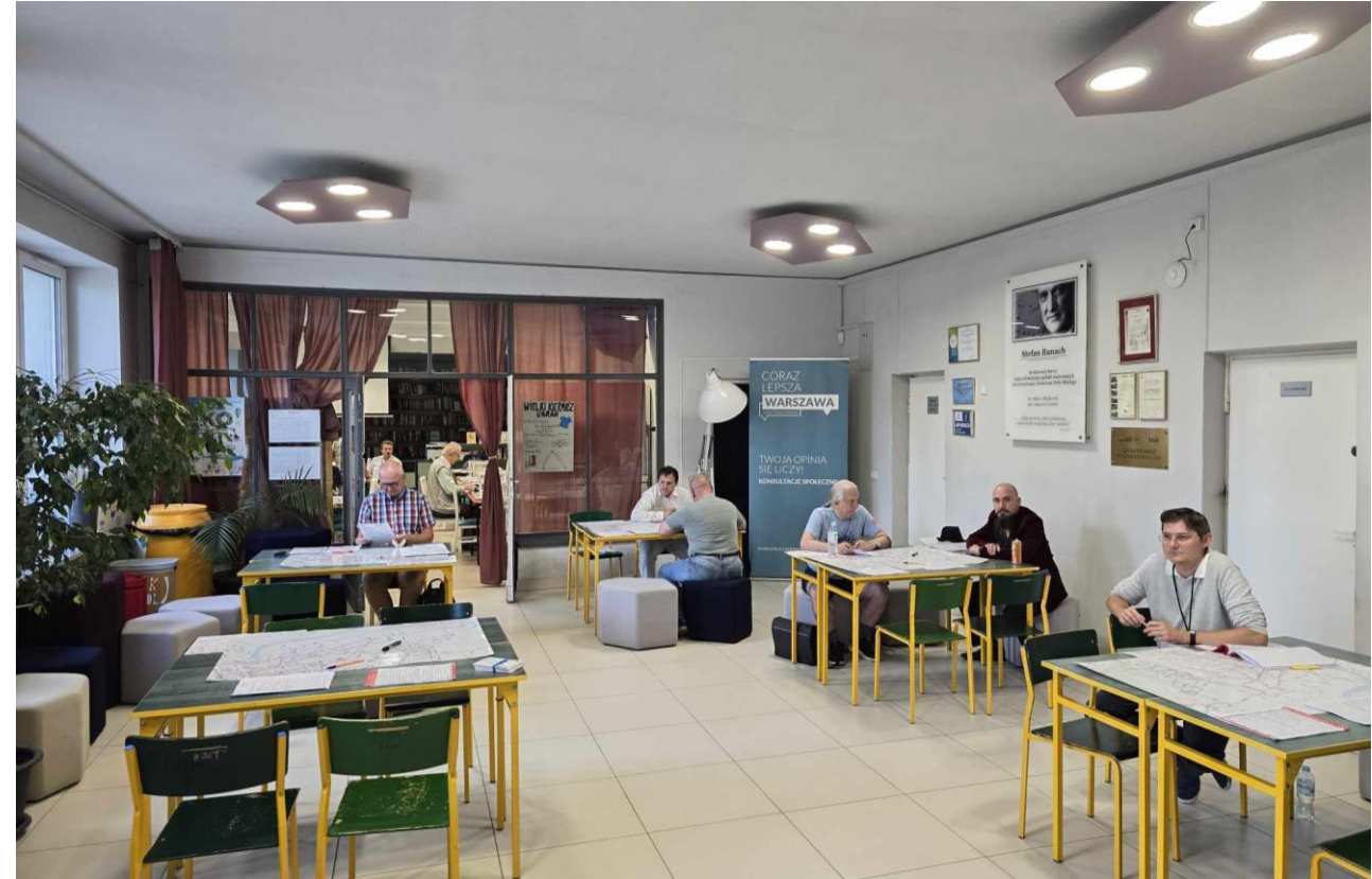
Dyżur konsultacyjny na Mokotowie