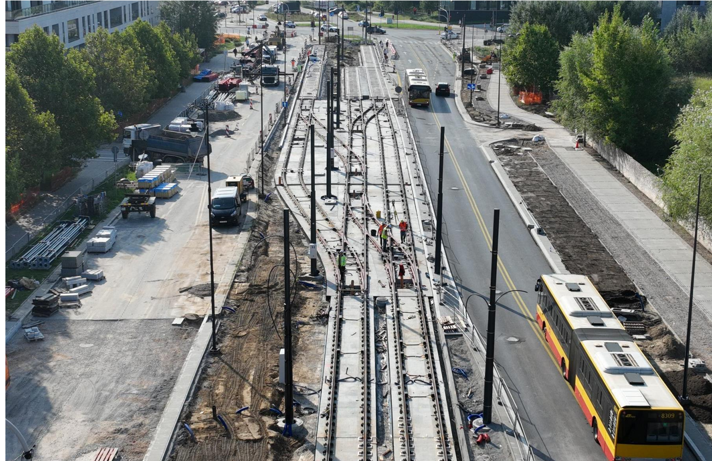
Przystanek końcowy w Miasteczku Wilanów

O tych zmianach będziemy informować na stronie Warszawskiego Transportu Publicznego .