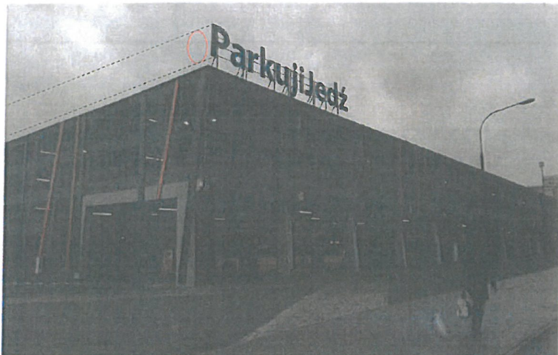
Rys. 5 i 6 P+R METRO STOKŁOSY