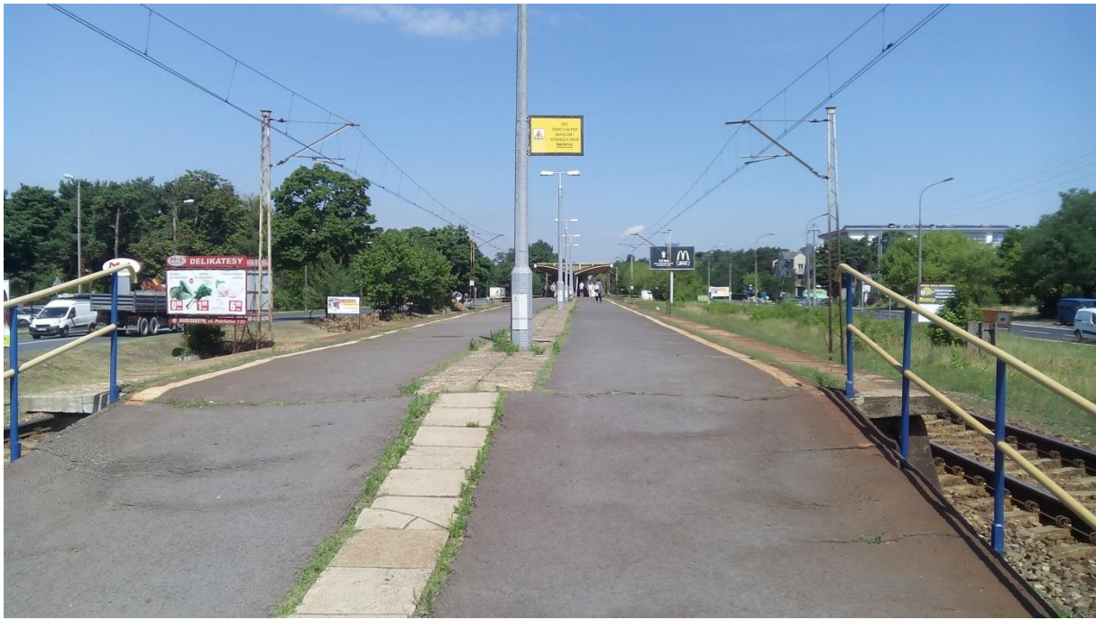
(peron stacji Warszawa-Miedzeszyn)