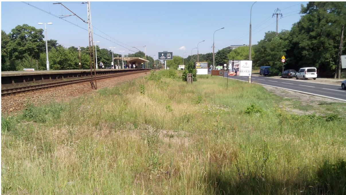
(zdjęcie terenu pod potencjalny parking od strony południowej)