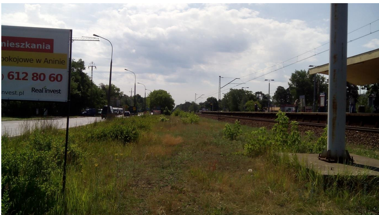
(zdjęcie terenu pod potencjalny parking od strony północnej)