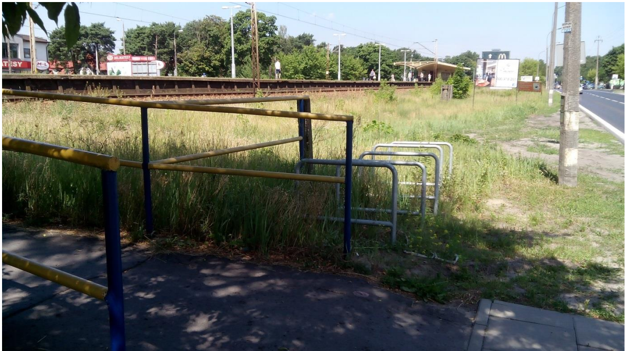
(Stojaki rowerowe południowe przejście)