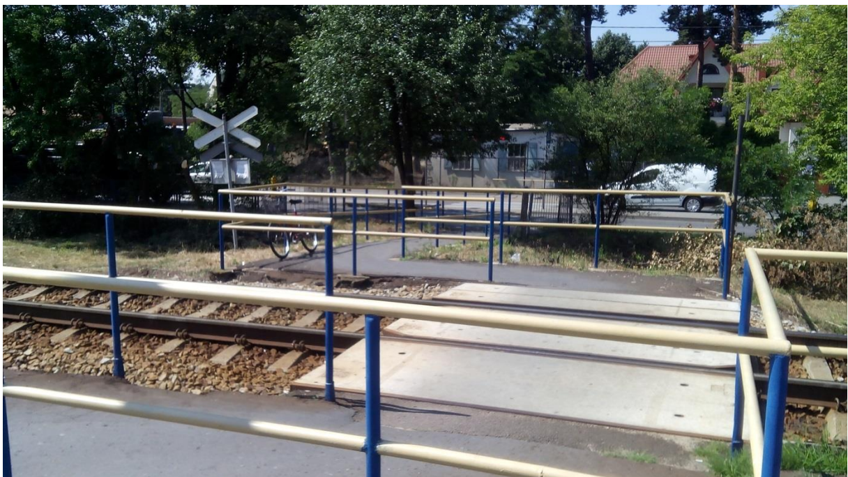
(przejście kolejowe w obrębie stacji Warszawa Miedzeszyn)