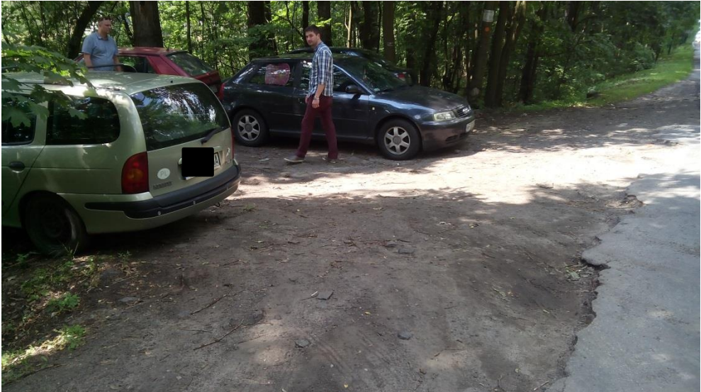
(Wjazd od strony zachodniej)

Samochody w tej części parkują na klepisku pomiędzy drzewami dostępnym dwoma stwarzającymi zagrożenie wjazdami od ulicy Okuniewskiej.