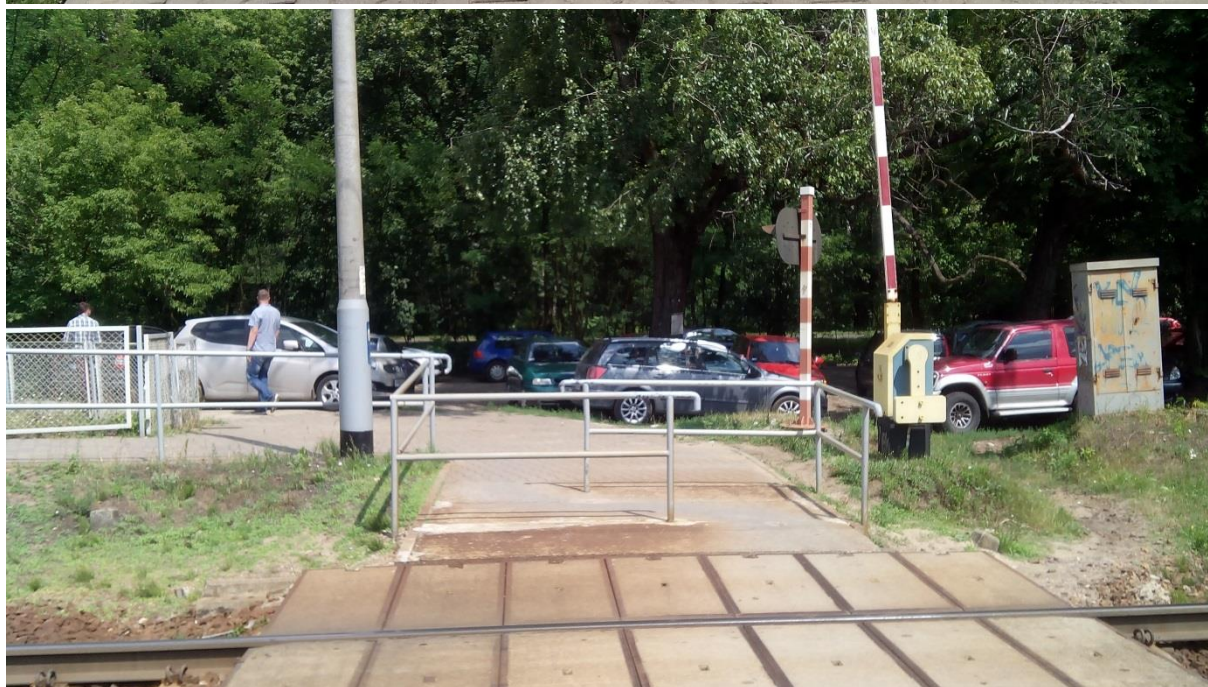
(Przejście kolejowe kategorii E w obrębie stacji)