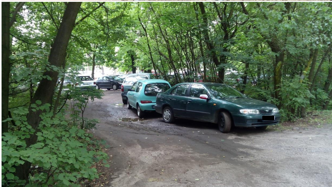
(zdjęcia przedstawiające sposób zaparkowania samochodów w rejonie [1])