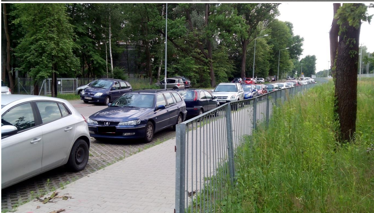
(Sposób parkowania samochodów w rejonie [3B])