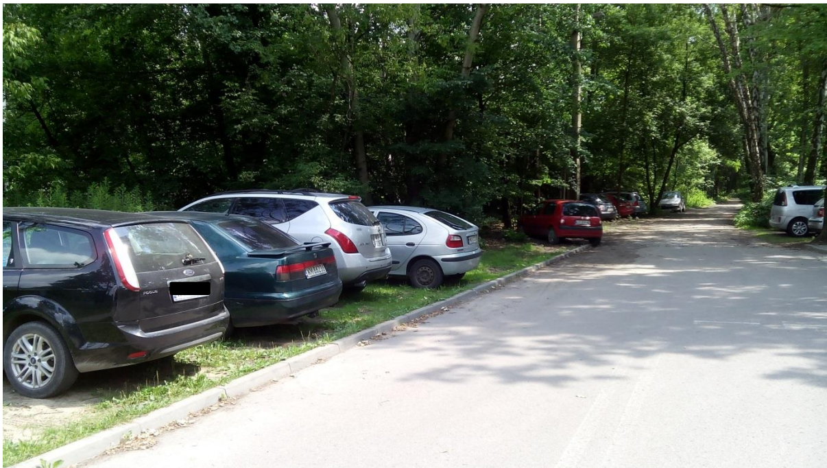
(sposób parkowania samochodów w rejonie [4])

W rejonie samochody parkują „na dziko” na nieutwardzonym poboczu drogi gruntowej (przedłużenie ulicy Głowackiego) oraz zieleńcu. Na dzień wizji lokalnej znajdowało się 15 sztuk zaparkowanych samochodów w tym obrębie.