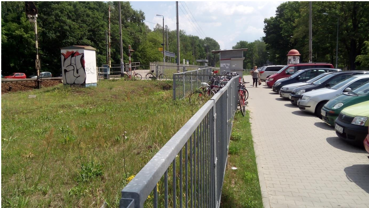
(sposób zostawiania rowerów przy stacji Warszawa – Wola Grzybowska)