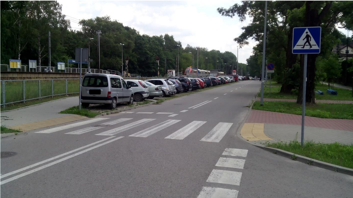
(sposób parkowania pojazdów w rejonie [3A])

W rejonie znajdują się istniejący parking z miejscami postojowymi dostępnymi z i prostopadłymi do ulicy Głowackiego. Brak wyznaczenia danego miejsca postojowego w ciągu parkingowym, co może powodować nieład w zajmowaniu powierzchni parkingu przez samochody i przez to ograniczeniu ilości samochodów, które mogą tam zaparkować. W dniu 29.06.2016 znajdowało się tam 35 sztuk zaparkowanych samochodów.