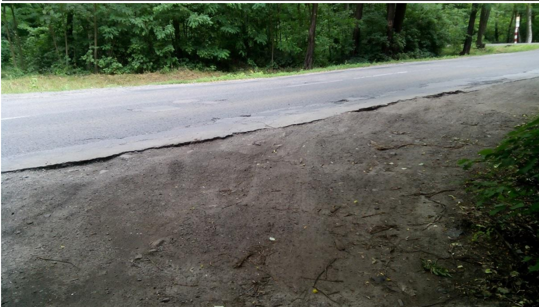
(Wjazd od strony wschodniej)

Pojazdy w tym miejscu parkują „na dziko” w sposób nieuporządkowany blokując istniejący chodnik prowadzący od terenu stacji do ulicy Okuniewskiej: