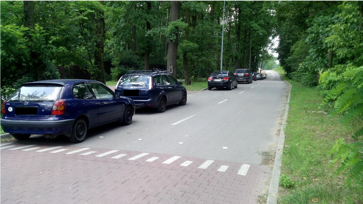
(sposób parkowania samochodów w rejonie [2])

W rejonie samochody parkują na jezdni w ciągu ulicy Głowackiego zgodnie z zasadami ogólnymi w ilości 15 sztuk.