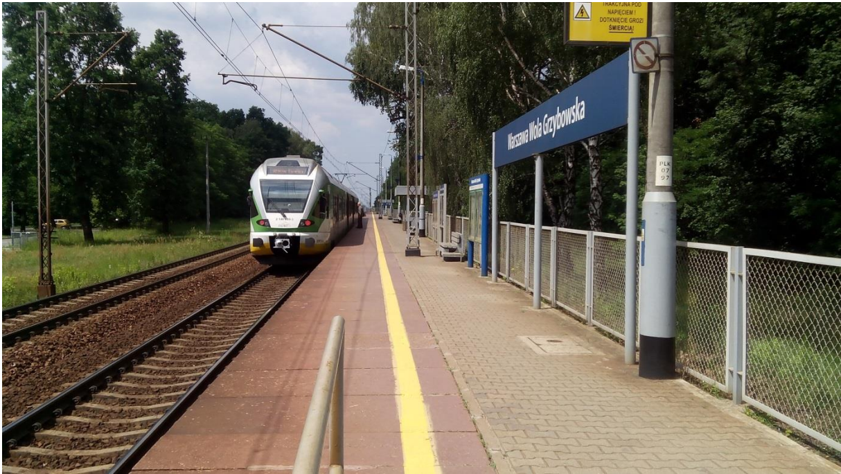
(peron stacji kierunek zachodni wraz z infrastrukturą towarzyszącą)