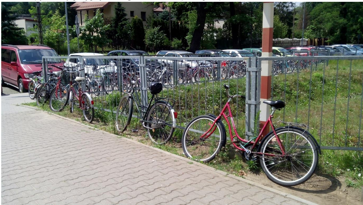
(sposób zostawiania rowerów przy stacji Warszawa – Wola Grzybowska)

Przy stacji oraz przejściu kolejowym znajdują się stojaki rowerowe, umiejscowione w dobrym widocznym miejscu. Ilość istniejących miejsc jest niewystarczająca, przez co podróżni zostawiają rowery przypięte do ogrodzenia stacji lub przejścia.